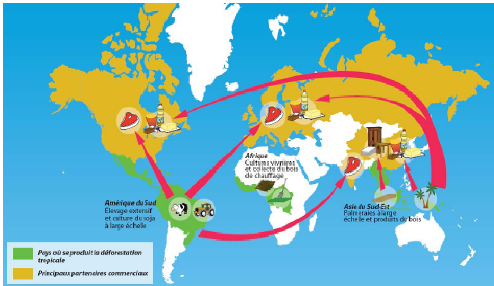
Figure 7 - Carte des principaux facteurs de déforestation

En Amérique du Sud, les forêts sont le plus souvent déboisées pour l'élevage du bétail et la culture du soja, tandis qu'en Asie du Sud-Est, la culture du palmier à huile et l'exploitation des produits du bois sont les premières causes immédiates de la déforestation. Dans ces deux cas, les marchés mondiaux où sont écoulées ces matières premières représentent la première cause sous-jacente de la déforestation. Leur importance est moindre en Afrique : la déforestation tend à être le fait des petits paysans qui pratiquent une agriculture vivrière et collectent du bois de chauffage.